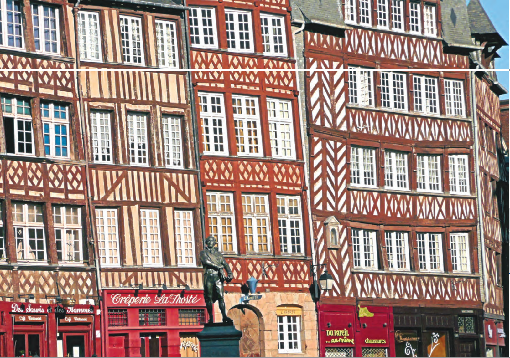
RENNES - Abitazioni tipiche