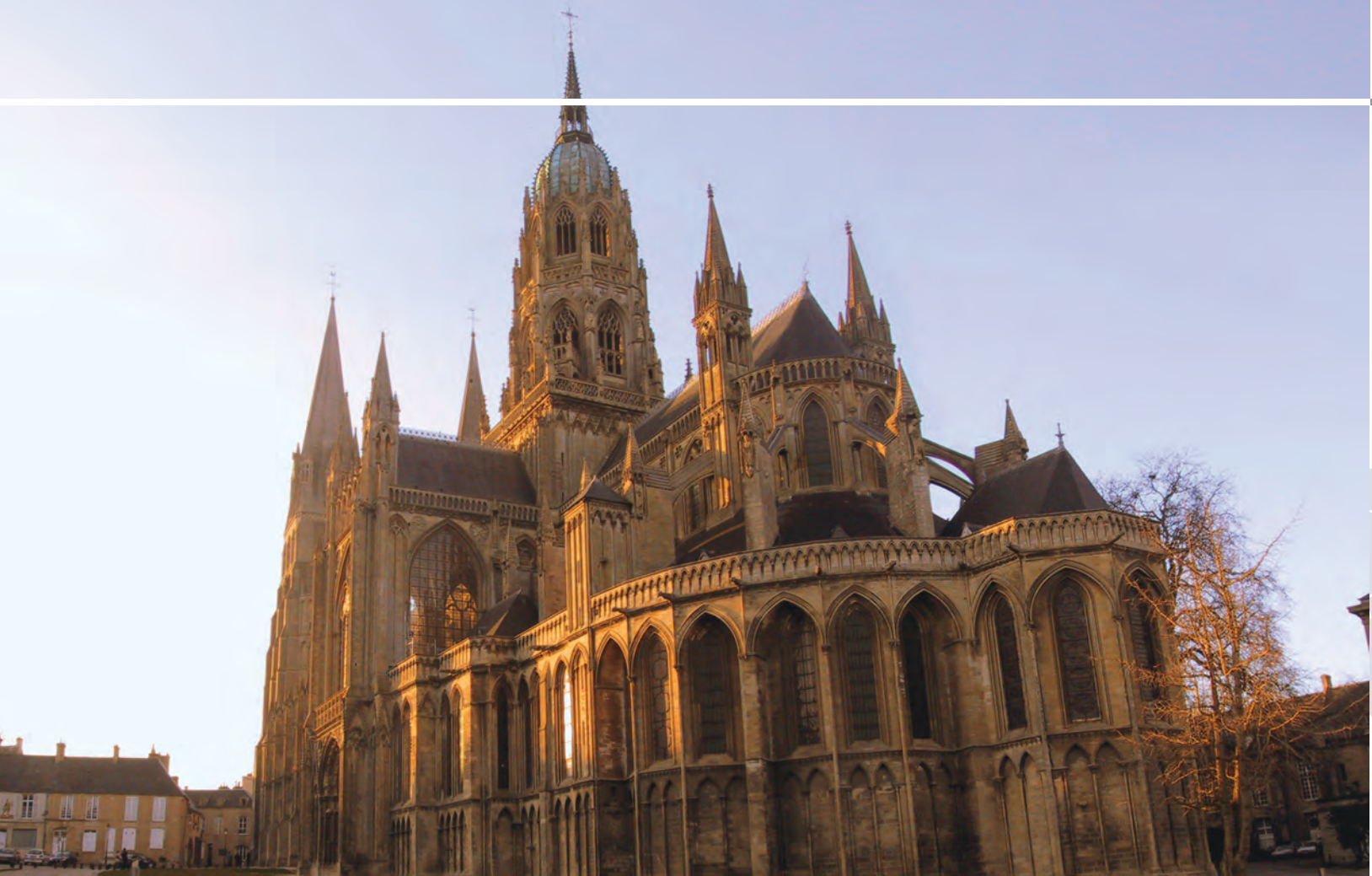
BAYEUX - Cattedrale