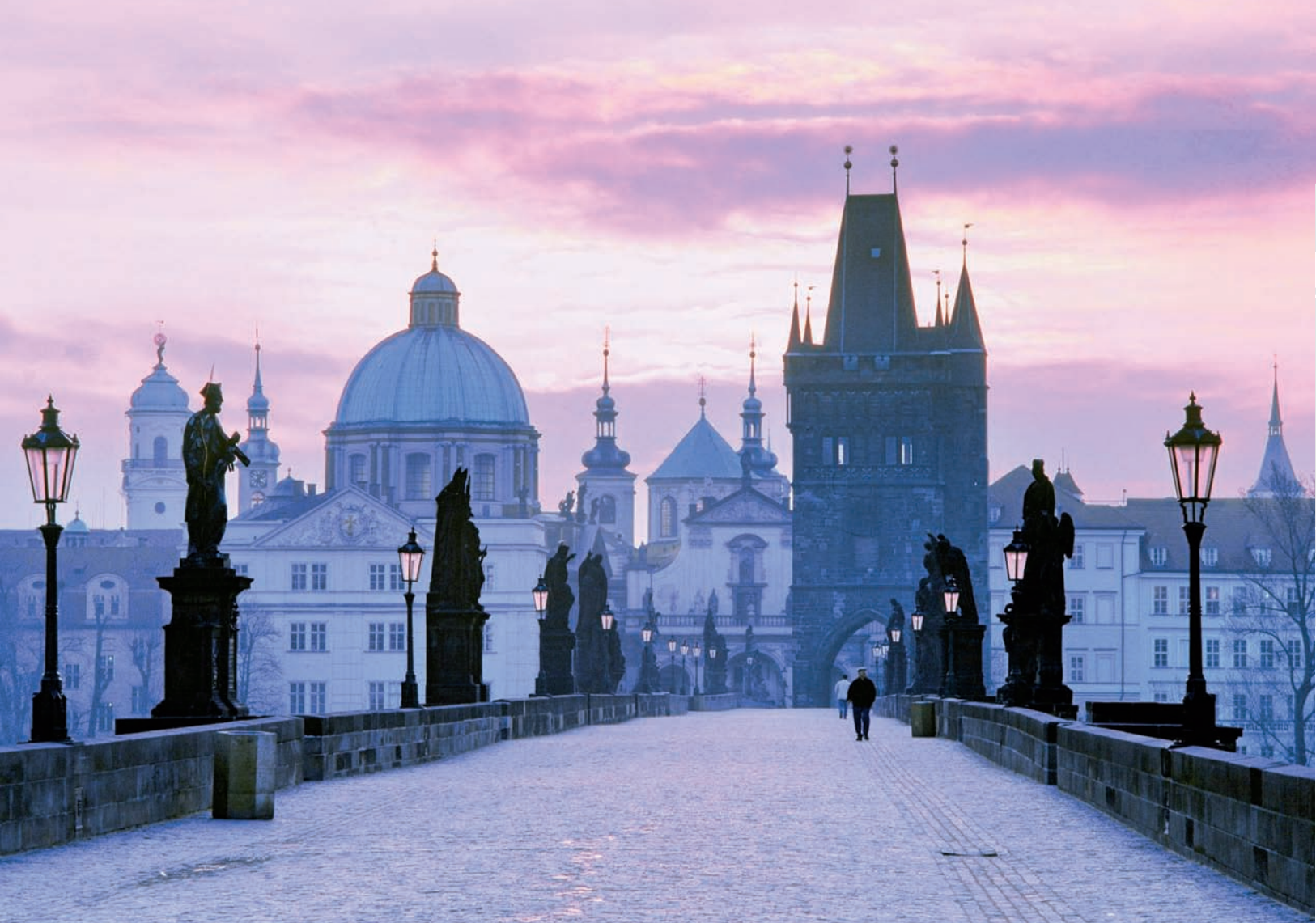
PRAGA - PONTE S. CARLO