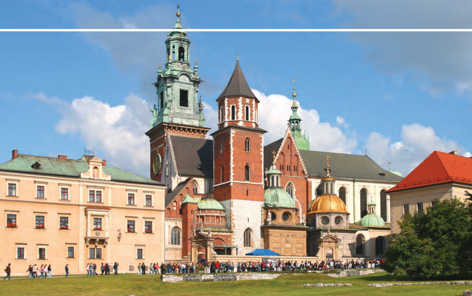
CRACOVIA - Cattedrale Wawel